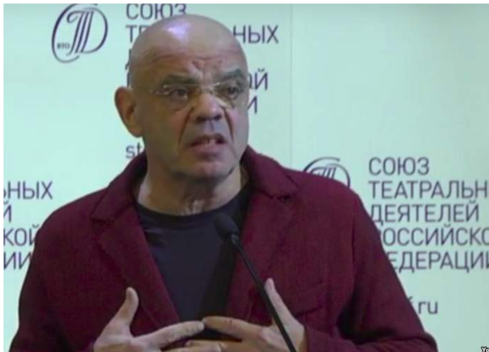
Константин Райкин.

«Нынешние фадетели за так называемую чистоту нравов, те, которые с возмущением кричат об оскорблении чувств верующих христиан, мусульман и прочее,