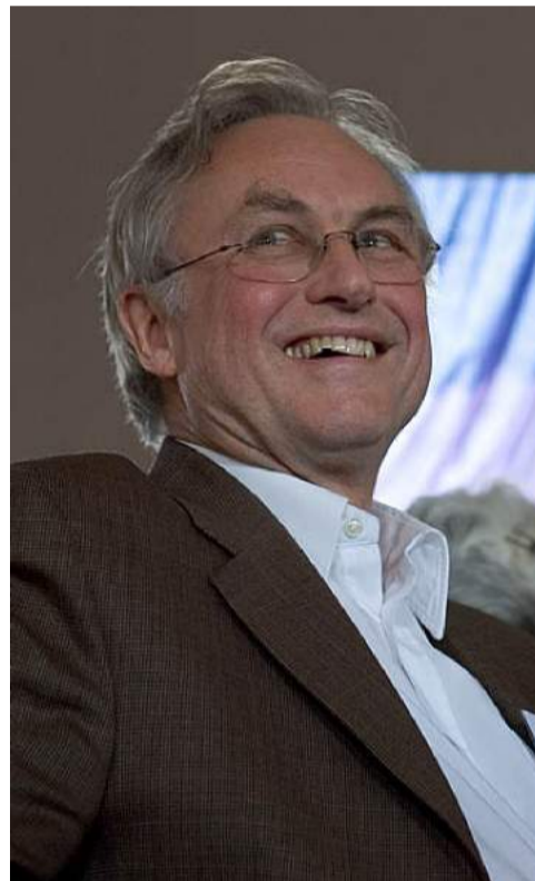
Ричард Докинз.